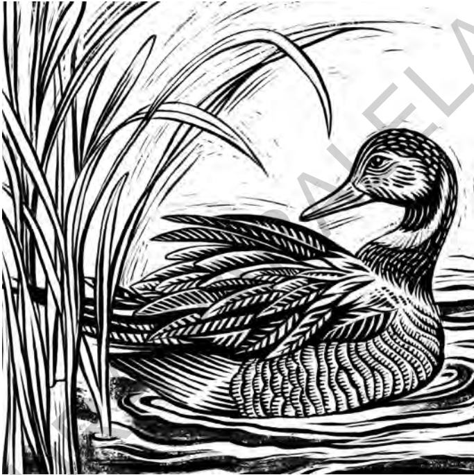
Penajul de eclipsă al raței